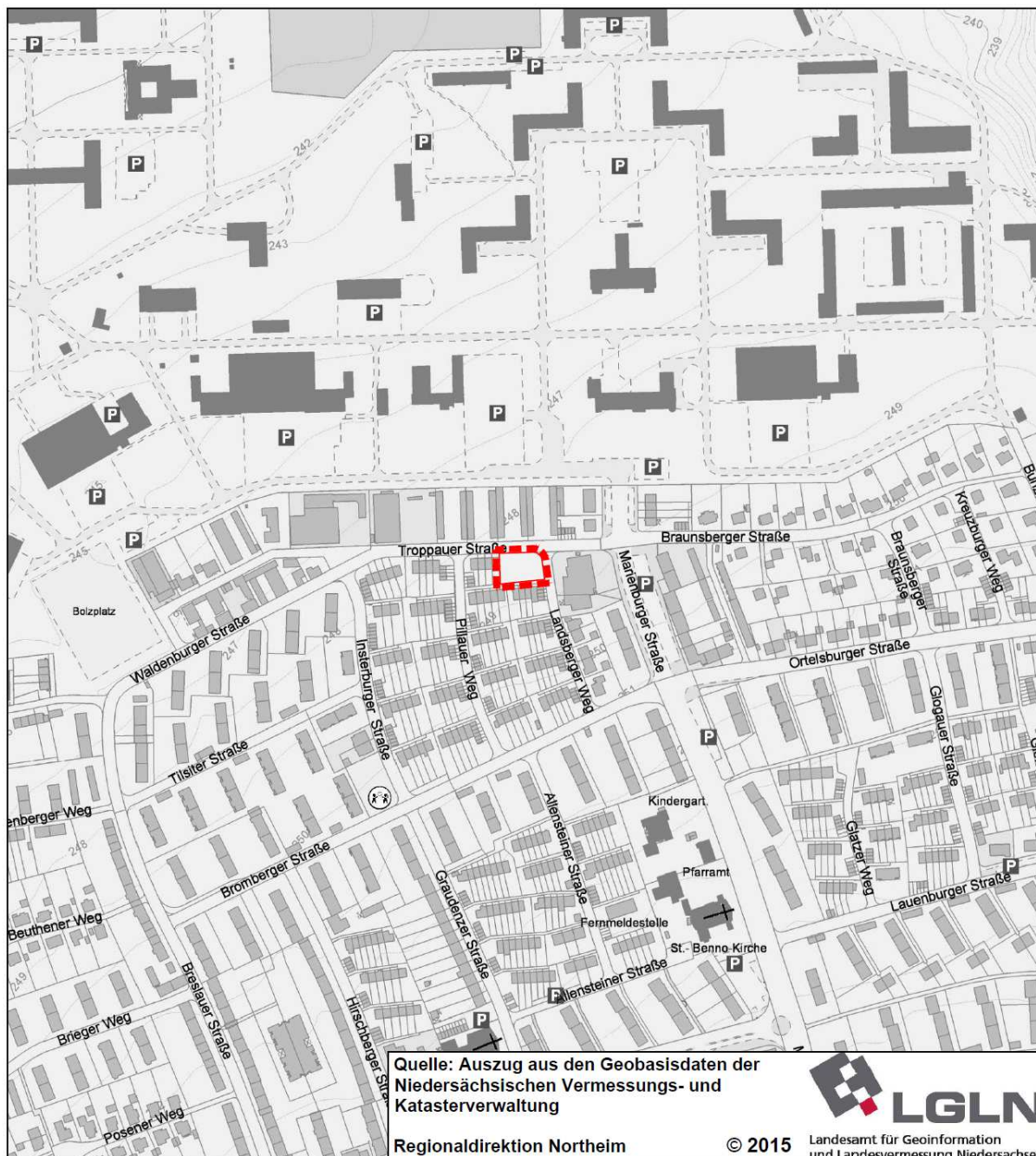
Übersichtsplan mit Darstellung der Lage im Stadtgebiet