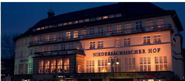
Hotel Niedersächsischer Hof ★★★★★ 60 €