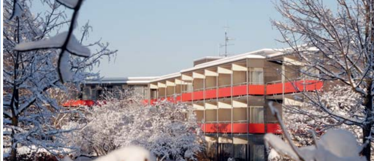
H + Hotel Goslar ★★★★★ 60 €