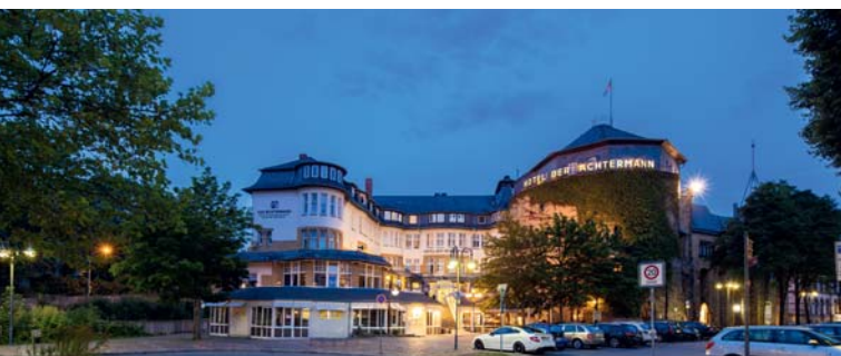
Hotel DER ACHTERMANN 60 €