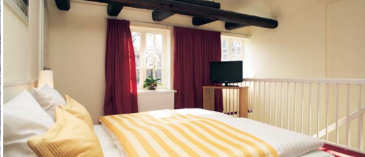
Hotel Schiefer 60 €