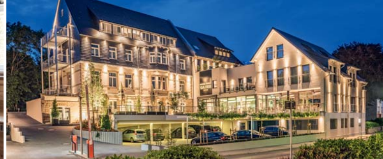
AKZENT Hotel Villa Saxer ★★★★★ S 67,50 €