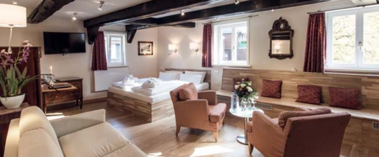
Romantik Hotel Alte Münze ★★★★★ 60 €