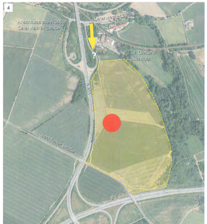
4 Östl. A 395 [Vienenburg Zentrum] Fläche: ca. 32 ha Erschließung: über Osterwiecker Straße [?]