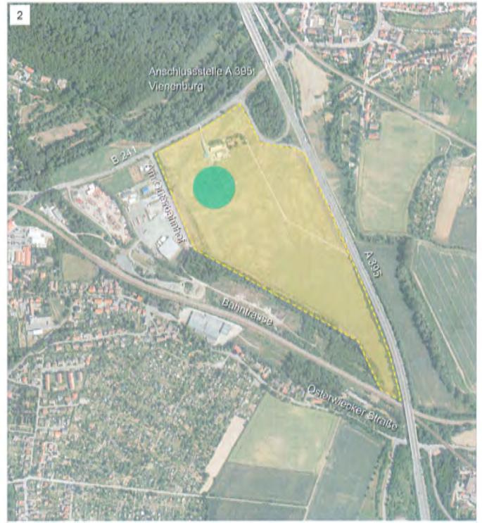
2 GE Vienenburg Ost [Vienenburg Zentrum] Fläche: ca. 18 ha Erschließung: über B241 / Am Güterbahnhof