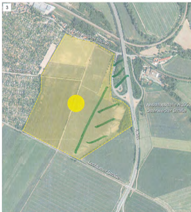
3 GE Güterbahnhof [Vienenburg Zentrum] Fläche: ca. 44 ha Erschließung: über Osterwiecker Straße