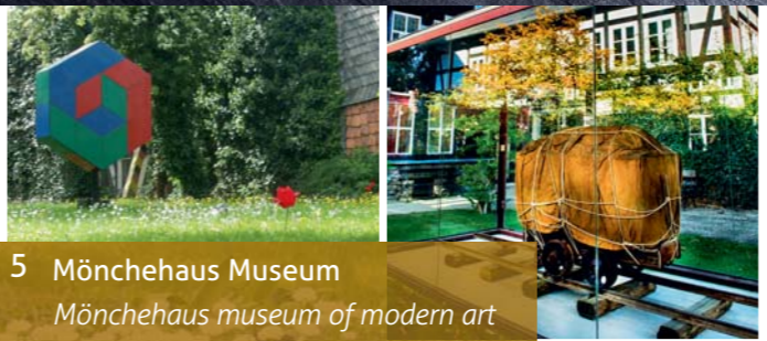
5 Mönchehaus Museum Mönchehaus museum of modern art

Anfahrt / contact: Klapperhagen 1 | 38640 Goslar | Tel. 05321 – 25889 www.zinnfigurenmuseum-goslar.de | Eingang / entry: Zinnfiguren-Museum Feste Führungszeiten / tour times: 1. Samstag im Monat 15:00 Uhr / 1st Saturday of the month 3pm | Ganztags am Deutschen Mühlentag, Welterbetag und Tag des offenen Denkmals / full-time on mill-day, World Heritage Day and Day of the open Monument | Weitere Führungen können jederzeit – auch kurzfristig – angefragt werden. / Further tours can be requested.