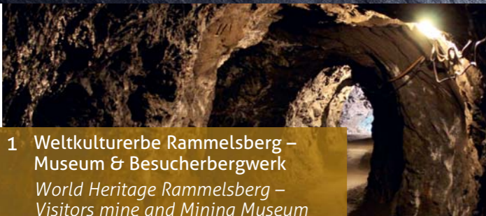
1 Weltkulturerbe Rammelsberg – Museum & Besucherbergwerk World Heritage Rammelsberg – Visitors mine and Mining Museum

Einzigartiges über und unter Tage: Das Museum und Besucherbergwerk bietet ein spannendes Abenteuer am Original-Schauplatz 1000-jähriger Bergbaugeschichte mit vier Museumshäusern, Führungen durch den historischen Roeder-Stollen, Fahrten mit der Grubenbahn und vielem mehr.