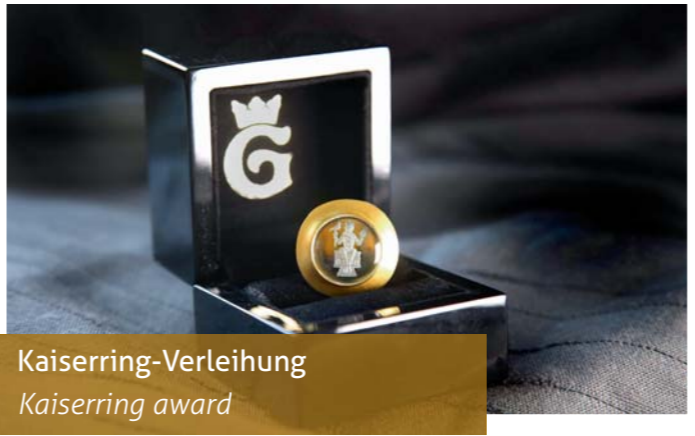
Kaiserring-Verleihung Kaiserring award

Anfahrt / contact: Mönchestr. 1 | 38640 Goslar | Tel. 05321 - 29570 www.moenchehaus.de Öffnungszeiten / opening hours: Dienstag – Sonntag 11 – 17 Uhr