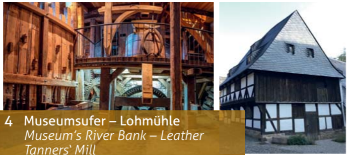
4 Museumsufer – Lohmühle Museum's River Bank – Leather Tanners' Mill

Anfahrt / contact: Kaiserbleek 6 | 38640 Goslar | Tel. 05321 - 3119693 Öffnungszeiten / opening hours: täglich / daily 10 – 17 Uhr