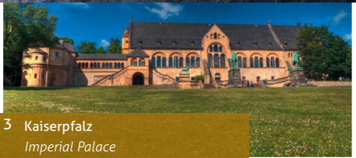
3 Kaiserpfalz Imperial Palace

Anfahrt / contact: Königstr. 1 | Klapperhagen 1 | 38640 Goslar Tel. 05321 - 43394 (Goslarer Museum) Tel. 05321 - 25889 (Zinnfigurenmuseum) Öffnungszeiten / opening hours: täglich 10 – 17 Uhr, montags geschlossen / closed on Mondays