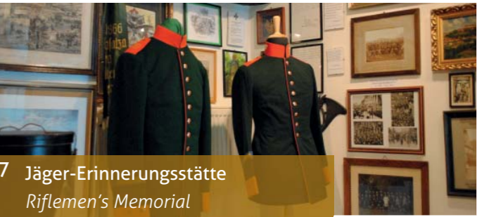
7 Jäger-Erinnerungsstätte Riflemen's Memorial

Anfahrt / contact: Thomasstr. 2 | 38640 Goslar. | Tel. 05321 - 43140 | www.zwinger.de Öffnungszeiten / opening hours: 15. März – 31. Oktober Dienstag – Sonntag 11 – 16 Uhr, November – 14. März auf Anfrage für Gruppen ab 10 Personen / upon request for groups of ten or more