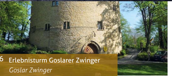
6 Erlebnisturm Goslarer Zwinger Goslar Zwinger

Every year the town of Goslar presents the internationally acclaimed art award, the „Kaiser Ring“, and the accompanying exhibit of works of the recipient opens at the Mönchehaus.