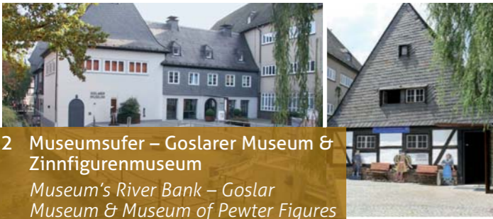
2 Museumsufer – Goslarer Museum & Zinnfigurenmuseum Museum's River Bank – Goslar Museum & Museum of Pewter Figures

Anfahrt / contact: Bergtal 19 | 38640 Goslar | Tel. 05321 - 7500 | www.rammelsberg.de Öffnungszeiten / opening hours: April – Oktober 9 – 18 Uhr | November – März 9 – 17 Uhr 24. & 31. Dezember geschlossen / closed on 24th & 31st December