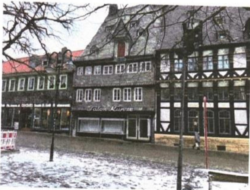
Blick aus Richtung Welterbezentrum